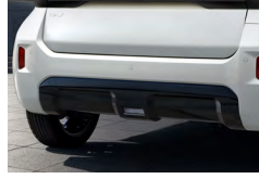
리어 스키드 플레이트