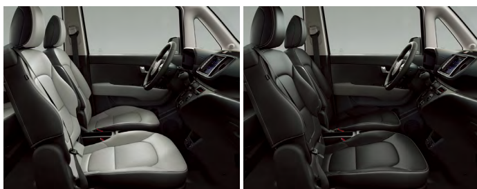
라이트 그레이 인테리어