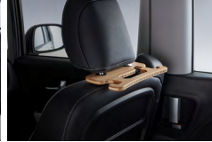
헤드레스트 멀티 후크