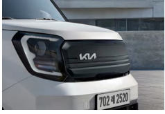
다크메탈 센터 가니쉬