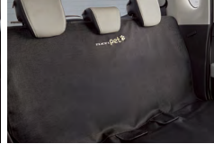
PET 방오시트 커버