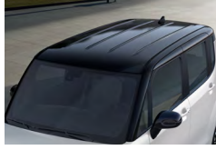
블랙루프, 블랙A필라, 블랙아웃사이드미러