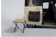
테이블&사이드 탐부착식 수납가방 set