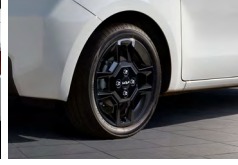
15인치 블랙 알로이 휠