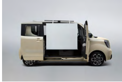
사이드 프로젝트 스크린