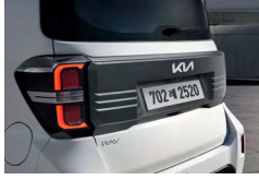
다크메탈 테일게이트 가니쉬