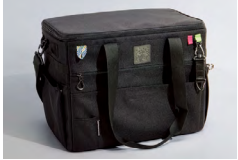
캠핑용 수납 가방