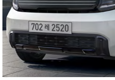
프론트 스키드 플레이트