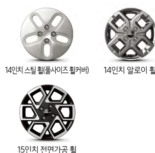
14인치 스틸 휠(폴사이즈 휠커버)